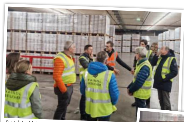
Betriebsbesichtigung bei der Firma Kaindl