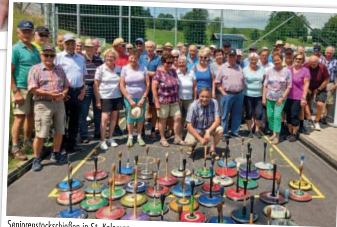
Seniorenstockschießen in St. Koloman