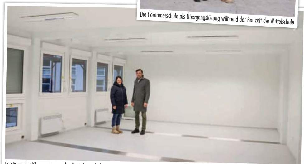
In einem der Klassenzimmer der Containerschule