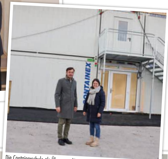
Die Containerschule als Übergangslösung während der Bauzeit der Mittelschule