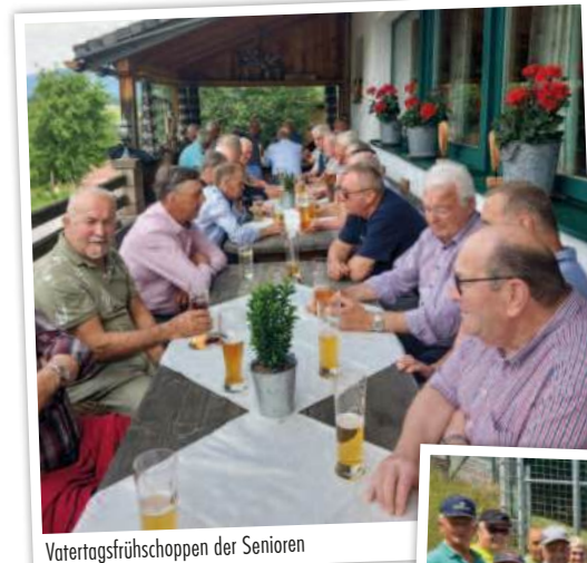
Vatertagsfrühstücken der Senioren