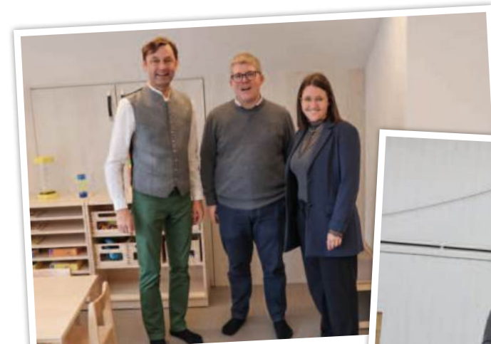
Kindgarteneröffnung in Voglau